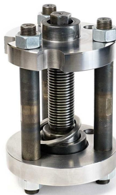
Транспортное положение пресса

Сайт: http://www.sto22.com , E-mail: waxoyl08@gmail.com , Телефон +7-800-700-2522 (звонок бесплатный)